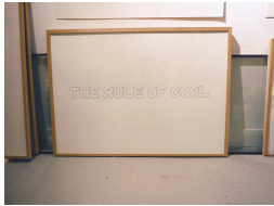
The Rule of Cool 2012 Papier perforé, bois, système électronique lumineux 70 X 100 cm