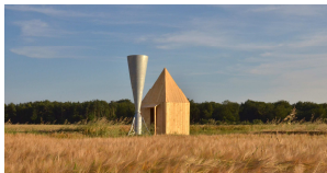
Les Variables Obsolètes 2013 Copie photographique d'une installation in situ 152 X 290 cm

A Fresnes-au-Mont en Lorraine, Nicolas Boulard s'adresse aux caprices météorologiques en bâtissant, au milieu des champs de blé, un cabanon avec un canon anti-grêle pouvant déplacer les nuages. Un instrument conique est pointé vers le ciel et projette par à-coups des détonations qui font la pluie et le beau temps.