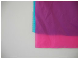
Monochrome (parachute) 2013 Toile de parachute 90 X 130 cm

Nicolas Boulard extrait le titre de son exposition à un principe «The rule of cool » qui guide la création de fictions cinématographiques et jeux vidéo, dans le prolongement de la notion formulée par le poète anglais Coleridge au XIX e s de « suspension d'incroyance ». Ce postulat met en évidence la faculté qu'a un lecteur, un joueur, un regardeur à tolérer tout fait irrationnel dans le but d'adhérer à la fiction en cours. Plus la fiction sera « cool » plus le spectateur sera en mesure d'adhérer à l'in vraisemblable.