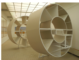
Aéroplane 2013 Bois, carton 600 X 250 X 280 cm

Nicolas Boulard a réalisé ces dessins à partir des formes laissées par les objets volants dans les champs de blé. Chaque année, entre 1000 et 2000 dessins sont relevés par les ufologues depuis les années 50. On peut constater une évolution esthétique dans les formes tracées dans les champs de blé, mais également, un style différent en fonction de la zone géographique.