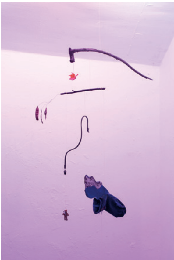
9 ■ Jay Tan, Batty and Grace : Songs of Puke and Nukekubi (sock n teddy mobile) , 2017, technique mixte, dimensions variables.