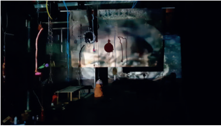
4 ■ Jay Tan, Are You Talking To Me [détail], 2018 – en cours, objets trouvés et offerts, accessoires de seconde main, ferraille, photocopies, dimensions variables.