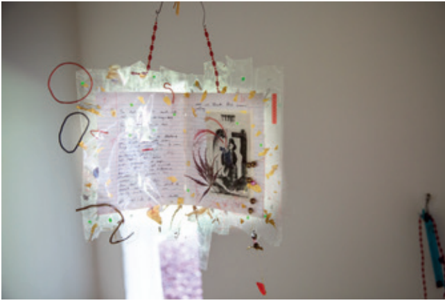
7 ■ Jay Tan, Ambitions , 2019, ruban adhésif, cahier d'exercices, feuilles, perles, petits jouets, 60 cm x 50 cm, Crédits photo : © Laura Brichta.