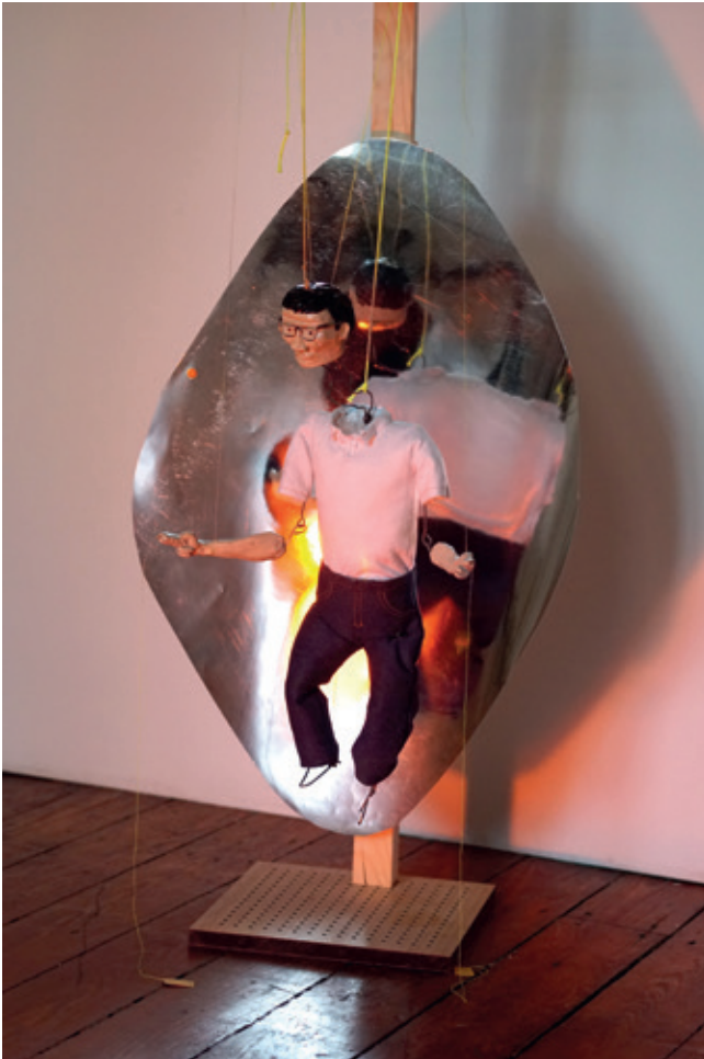
8 ■ Jay Tan, Chi Gong Dad , 2017, marionnette, technique mixte, enregistrement audio (9 min).