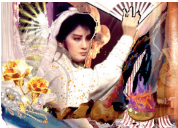
10 ■ Jay Tan, Do Girls Play Civ : Dream Lover , 2018, gif animé (en boucle).