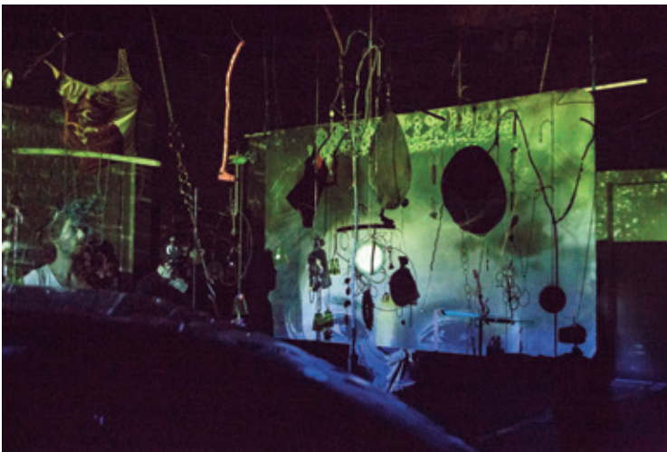
5 ■ Jay Tan, Are You Talking To Me [détail], 2018 – en cours, objets trouvés et offerts, accessoires de seconde main, ferraille, photocopies, dimensions variables.