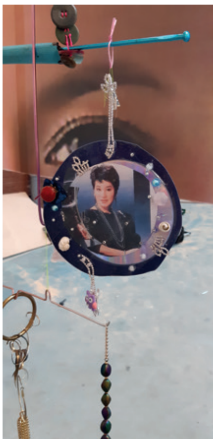
3 ■ Jay Tan, Are You Talking To Me [détail], 2018 – en cours, objets trouvés et offerts, accessoires de seconde main, ferraille, photocopies, dimensions variables, Crédits photo : © Aurélien Mole – CACC.