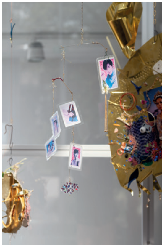
2 ■ Jay Tan, Are You Talking To Me [détail], 2018 – en cours, objets trouvés et offerts, accessoires de seconde main, ferraille, photocopies, dimensions variables, Crédits photo : © Aurélien Mole – CACC.