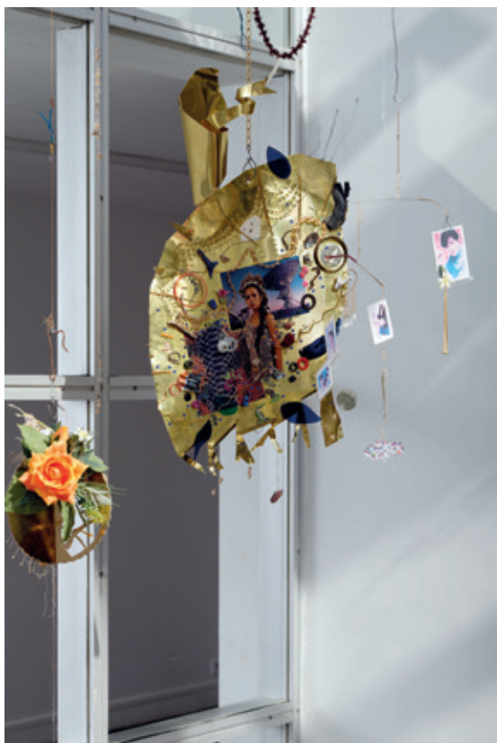
1 ■ Jay Tan, Are You Talking To Me [détail], 2018 – en cours, objets trouvés et offerts, accessoires de seconde main, ferraille, photocopies, dimensions variables, Crédits photo : © Aurélien Mole – CACC.