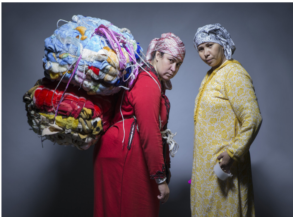
3 ■ Libération , De la série Nabila & Keltoum & Khadija , 2015 Prêt de la Collection du FRAC CHAMPAGNE-ARDENNE ©Randa Maroufi