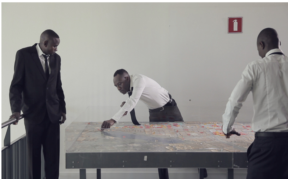
4 ■ Stand-by-office , 2017 En collaboration avec le groupe « We Are Here », Amsterdam. Avec le soutien de : Le Fresnoy, Culture Resource's Production Awards Program, CBK Zuidoost, Cinelabs Romania, Studio aux cuves dorées.