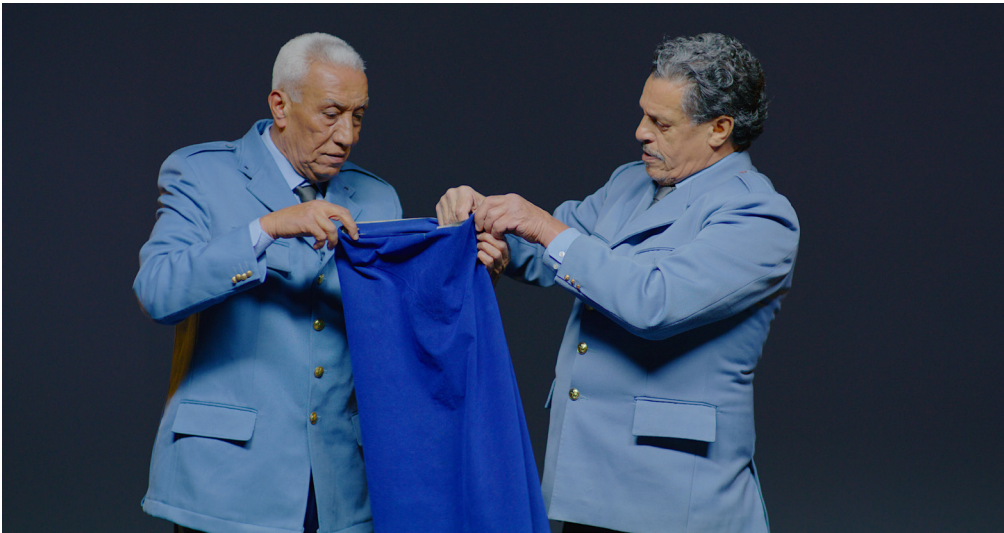
5 ■ Les plieurs , 2021 Co-produit par le CACC – Clamart ©Randa Maroufi