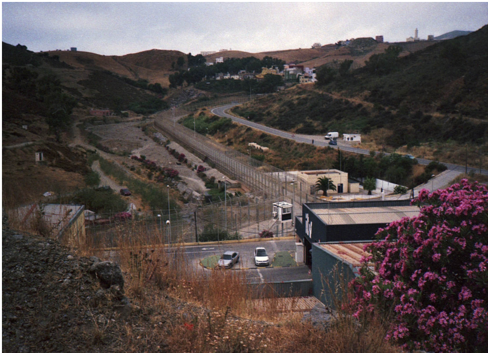
1 ■ Around the gate , De la série : Indissociable