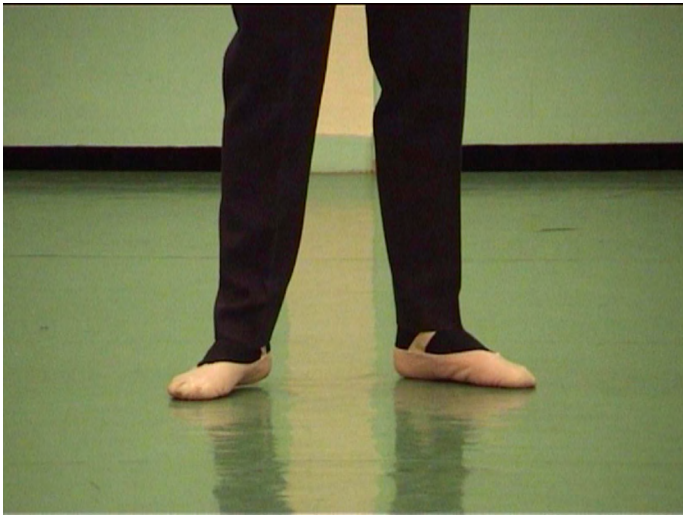
Lorraine Féline, Martita , 2007 Film couleur, sonore, durée 9'40 Image extraite du film © Lorraine Féline