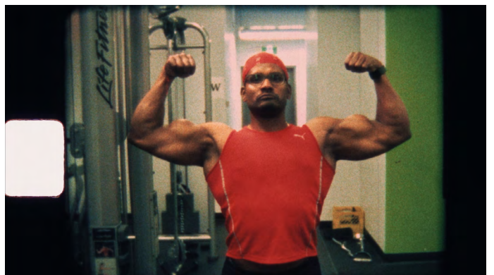
Ian Bawa, Strong Son , 2020 Film super8, couleur, sonore, durée 4' Image extraite du film © Ian Bawa