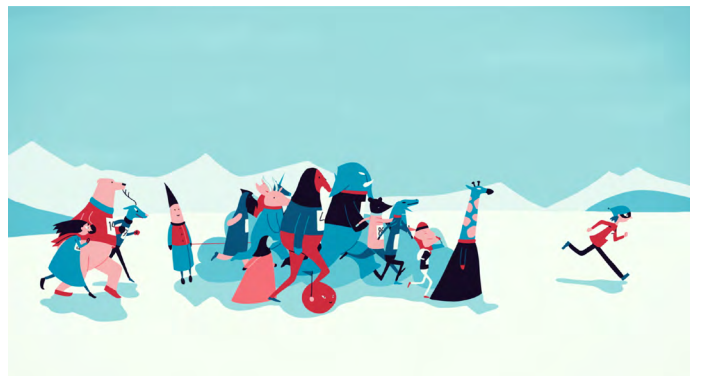
Hanne Berkaak, Le jour du marathon , 2015 Film d'animation, couleur, sonore, durée 7'30, distribution Agence du court-métrage Image extraite du film