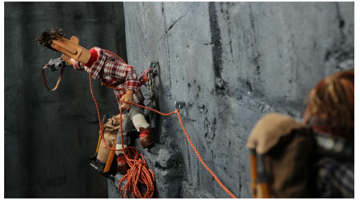
Ignasi López Fábregas, Viacruxis , 2018 Film d'animation, couleur, sonore, durée 11' Image extraite du film