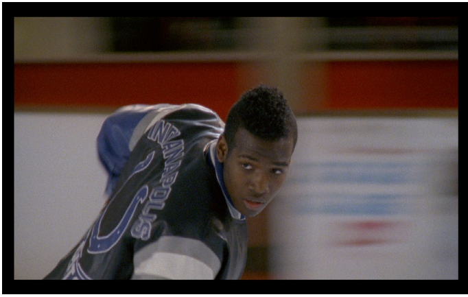
Antoine Danis, Traversées , 2013 Film, couleur, sonore, durée 8'17, distribution Grec Image extraite du film © Antoine Danis, Grec