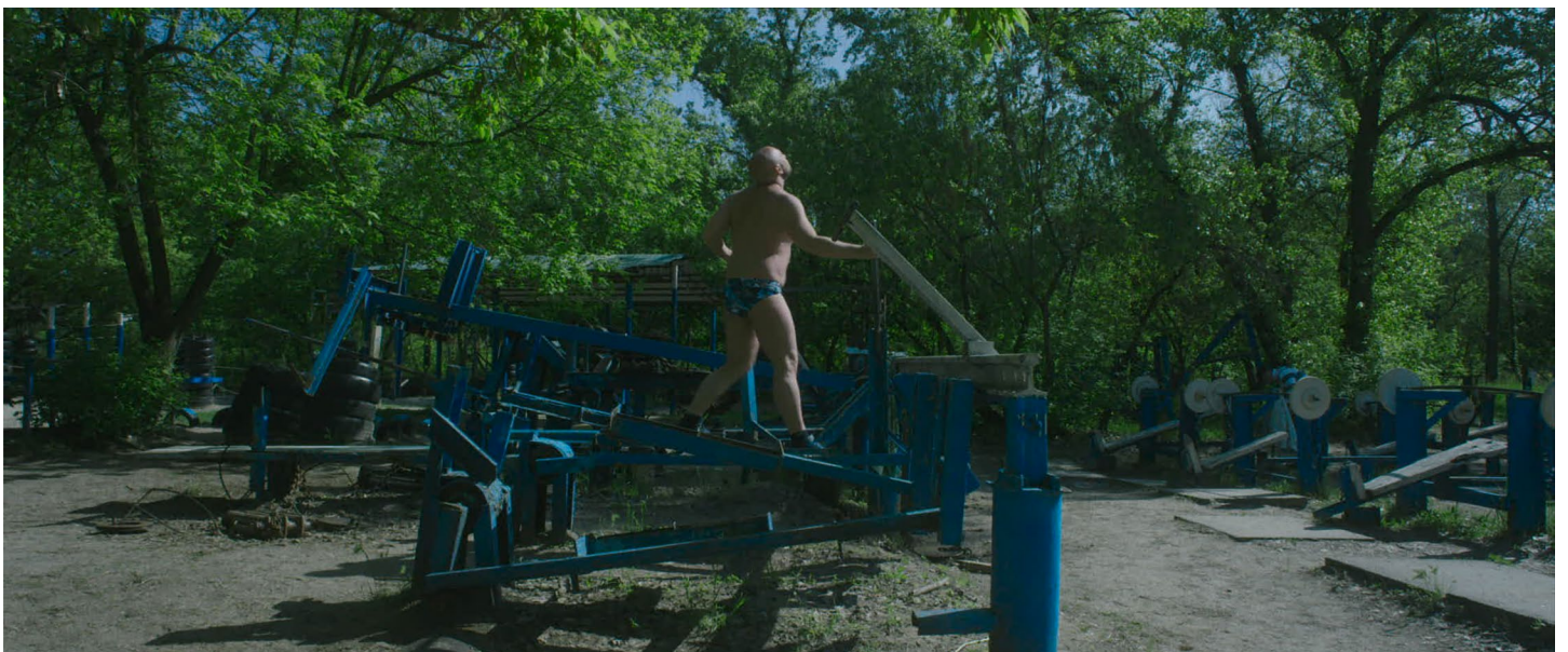
Gar O'Rourke, Kachalka , 2019 Film documentaire, couleur, sonore, ukrainien sous-titré en français, durée 9'20 Image extraite du film © Gar O'Rourke