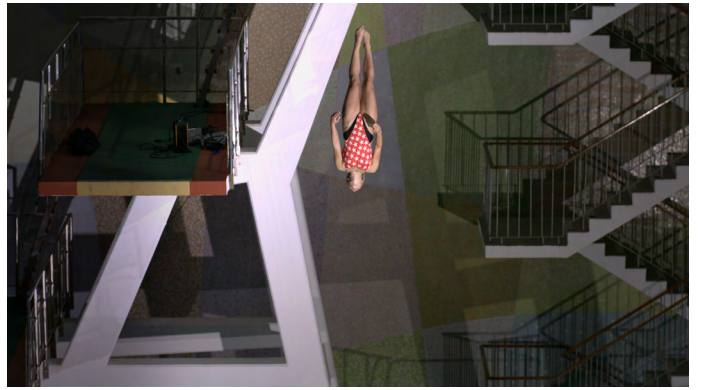
Axel Danielson & Maximilien Van Aertryck, Hopptornet (Ten Meter Tower) , 2016 Film couleur sonore, suédois sous-titré en français, durée 16'18 Image extraite du film