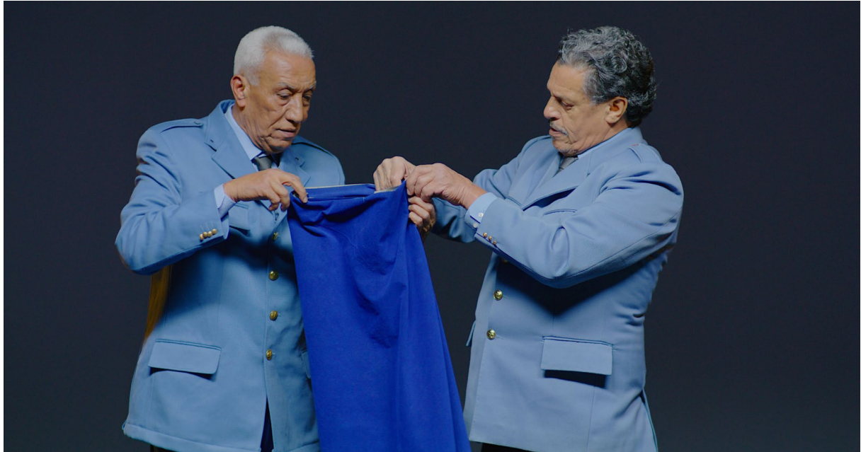
Les plieurs, 2021 Co-produit par le CACC – Clamart