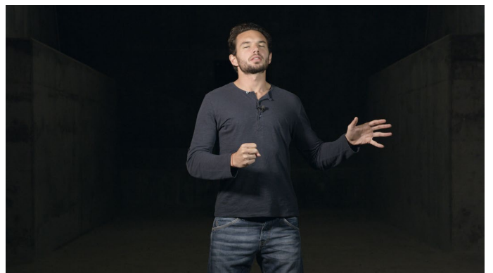
Camille Llobet, Faire la musique , 2017 Vidéo 4K, couleur, son stéréo, durée 15'27 Image extraite du film