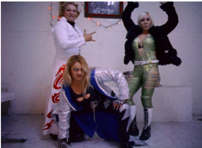
Marie Losier, Bim Bam Boum, Las Luchadoras Moreno ! , 2016 Film documentaire, couleur, sonore, espagnol, sous-titré en français, durée 13' Image extraite du film