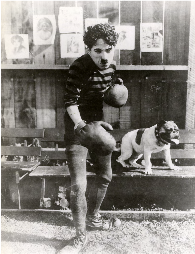
Charlie Chaplin, The Champion - Charlot Boxeur , 1915. Film noir et blanc, muet sonorisé, durée 29'39, distribution Lobster Films