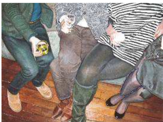
Thomas Levy-Lasne-Fête n°54 (aquarelle sur papier 15x20cm) 2013