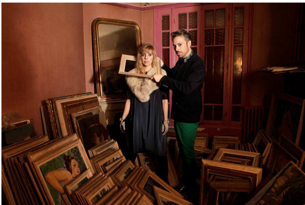
Stylisme : Anaïs Delcroix / Maquillage et coiffure : Delphine Birarelli

Exposition du 17 Avril au 7 Juillet 2013 Vernissage public mardi 16 avril à 18h00