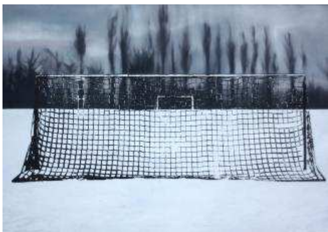
Eva Nielsen, Villeneuve-Triage , 130 x 180, 2010, huile, acrylique et sérigraphie sur toile